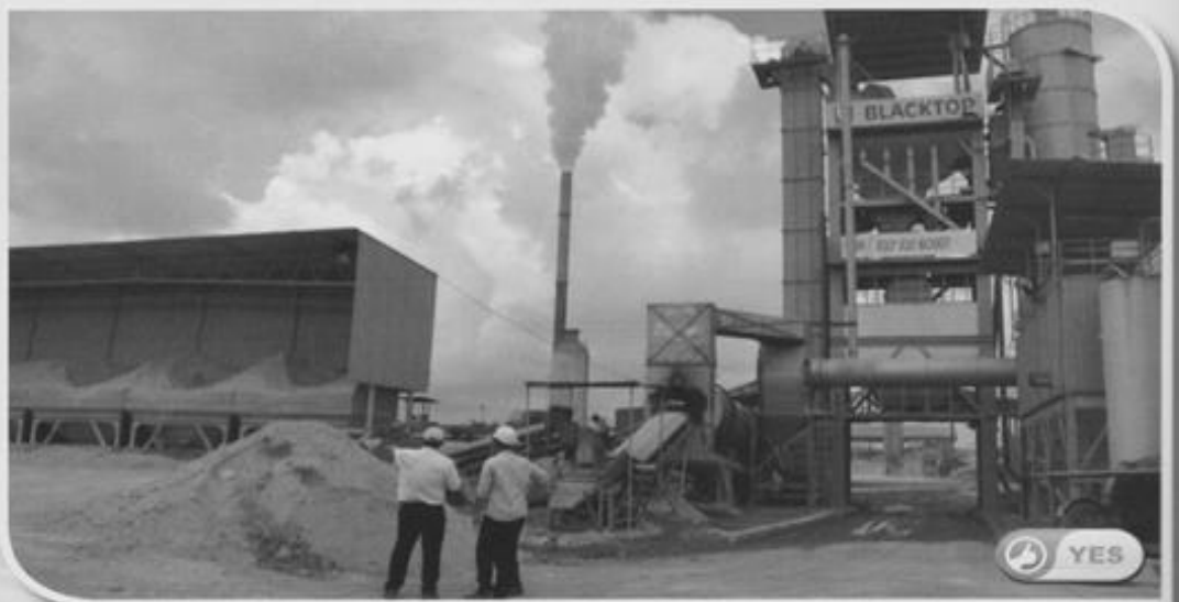
KUARI BLACKTOP INDUSTRIES SDN BHD DI SALAK TINGGI, SELANGOR

SENARAI KUARI YANG DIKTIRAF OLEH JKR MALAYSIA DI SELANGOR